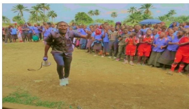
Les élèves étaient ravis et ont spontanément chanté pour remercier la Princesse Belle.

Après avoir été gracieusement remerciée par le directeur du lycée et les étudiants reconnaissants, la Princesse Belle a ensuite noué des liens avec les dirigeants du pays, prônant la création d'emplois locaux et l'adoption de son système d'investissement : Le « Financement Équitable » du groupe AAA Intergalactic . La Princesse Belle, PDG, avec toute sa concentration, son esprit combatif et de gagnant a vivement déclaré : « Nous devons d'abord créer des milliers d'emplois, ensuite je me réjouirai ! »