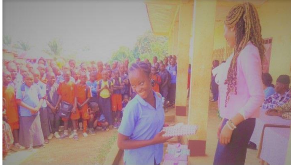
La Princesse Belle, PDG du groupe AAA Intergalactic, a distribué des bourses

La jeune et dynamique PDG a également été chaleureusement accueillie par des aristocrates africains telles que Sa Majesté Joseph Ekandjoun, Roi de Baréhock. La Princesse Belle a été saluée comme une modèle citoyenne du monde, philanthrope, activiste et excellente entrepreneure.