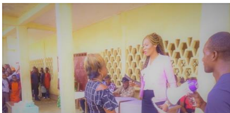
La Princesse Belle, PDG du groupe AAA Intergalactic, distribue des cadeaux en espèces aux meilleurs professeurs en Afrique.

Les bourses du groupe AAA Intergalactic ne sont donc pas simplement un « beau geste » philanthropique; ce sont des investissements essentiels pour aider les étudiants, en particulier les jeunes femmes, et les communautés à lutter contre la pauvreté.