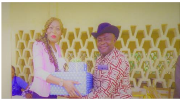
Princess Belle donated school supplies to the Lycée's management, and gifts to the best teachers.