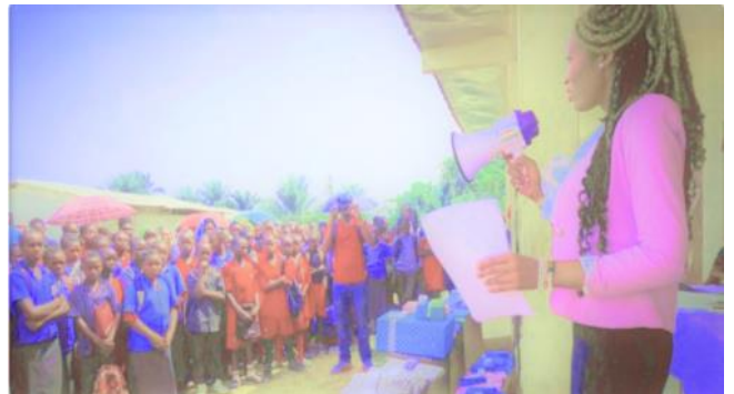
AAA Intergalactic's CEO donated school supplies and gifts to students.